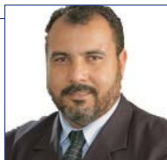
DR MICHEL Deputado Distrital

LINK: http://legislacao.cl.df.gov.br/Legislacao/consultaProposicao-111706!2013!visualizar.action